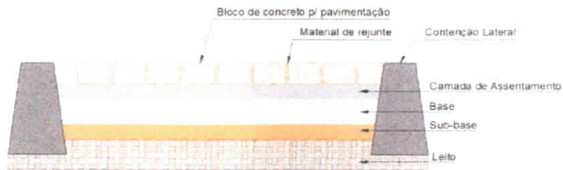
Figura 2 – corte esquemático

Execução de pavimento com piso intertravado de concreto sobre leito de material granular (areia média). Após o assentamento do piso intertravado será feita a compactação e rejuntamento com pó de pedra. A execução observará as especificações da ABNT NBR 15953:2011 - Pavimento intertravado com peças de concreto — Execução.